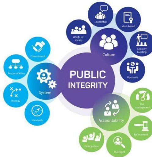
2017 OECD Recommendation on Public Integrity and analytical framework for the integrity review

Source: OECD elaboration. OECD 2017 Recommendation of the Council on Public Integrity. www.oecd.org/gov/ethics/recommendation-public-integrity.htm